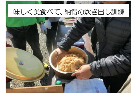
美味しく美食べて、納得の炊き出し訓練