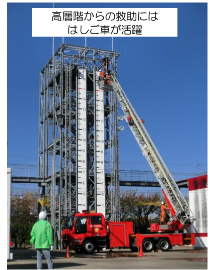
高層階からの救助には はしご車が活躍