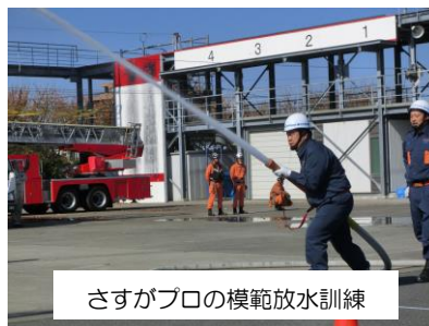
さすがプロの模範放水訓練