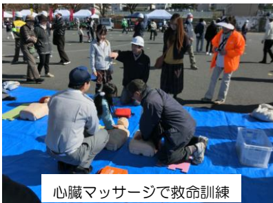
心臓マッサージで救命訓練