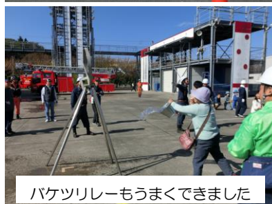
バケツリレーもうまくできました

今年度は、できるだけ昨年とは違う訓練に参加して防災意識と防災技術を高めましょう!