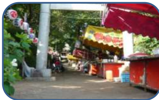
秋祭り(境内の歌謡ショー)