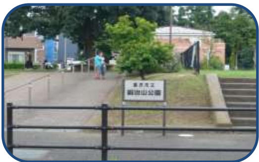
昭和30年頃南鍛冶山遺跡付近