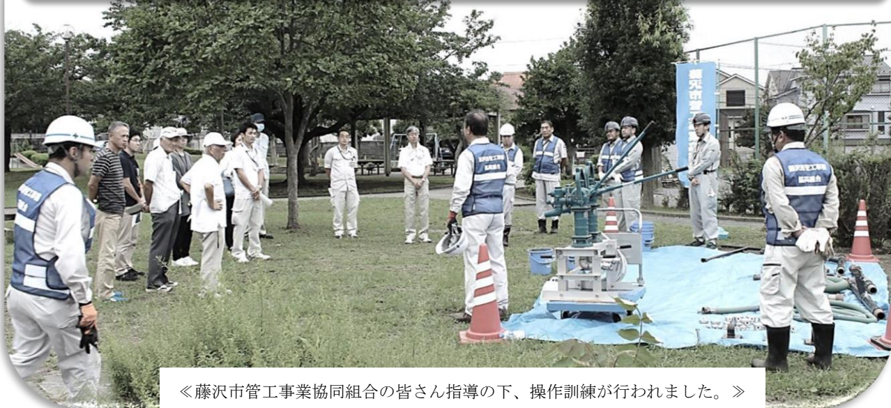
《藤沢市管工事業協同組合の皆さん指導の下、操作訓練が行われました。》

天神町にある天神公園。ここの地下に『耐震性飲料用貯水槽』が設置されています。同じような貯水槽は、市内に14ヶ所設置されています。