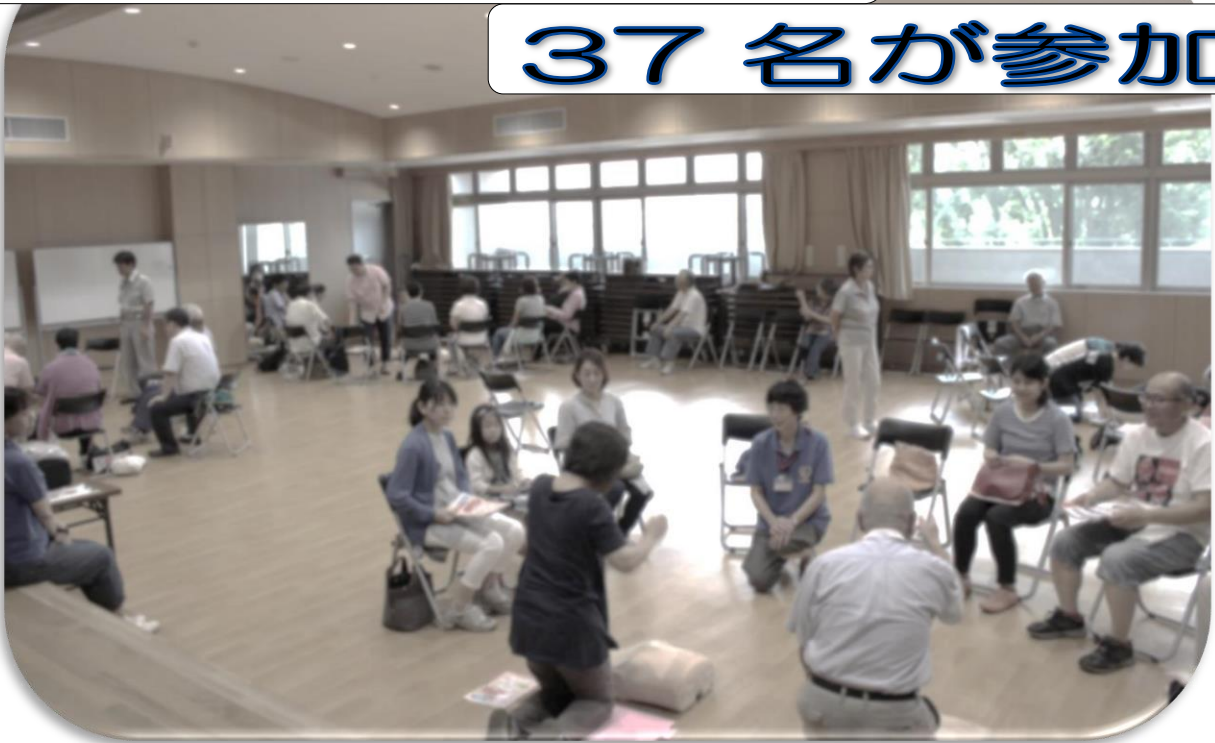
《講習の様子。みなさん真剣です！》

7月31日（日）、六会市民センターにおいて「救急救命講習」が開催されました。当日は、北消防本署の職員1名、普及員4名、計5名の講師の方々に、分かりやすくAED操作訓練等をご指導いただきました。