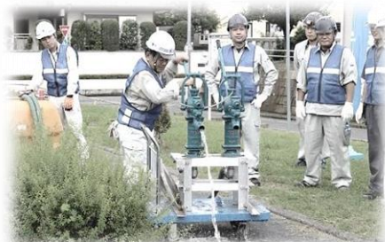
《手動ポンプによる操作》