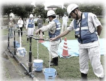
《電動ポンプでくみ上げた水》

「藤沢市管工事業協同組合」をはじめとする業者の方々にご指導いただきながら、手動式ポンプやエンジンポンプの操作