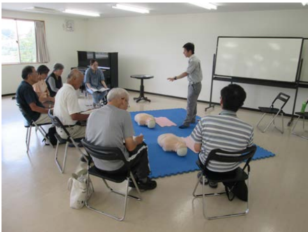
講師の方の指導を熱心に聞いています

六会地区防災リーダー連絡会では、この救急救命講習を、毎年7月ごろに恒例の事業として開催しています。今年参加できなかったという方は、ぜひ来年ご参加ください！