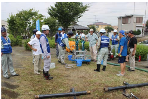
大勢の方が参加されていました

こうした設備はあくまでも災害時の緊急用です。私たち一人ひとりが、日ごろから飲料水・非常食を備蓄するという心がけも重要です。今回の訓練は、そういった防災意識について改めて考えるきっかけにもなったように思います。