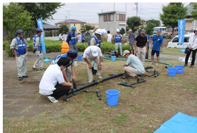
給水管の接続にチャレンジ！

なお、藤沢市管工事業協同組合の皆様も参加される「平成27年度藤沢市総合防災訓練」が、8月29日（土）の午前10時～正午まで、藤沢市消防防災訓練センター（六会市民センターの隣にある施設です）で開催されます。当日は、人命救助訓練、道路復旧訓練等、様々な訓練が予定されています。