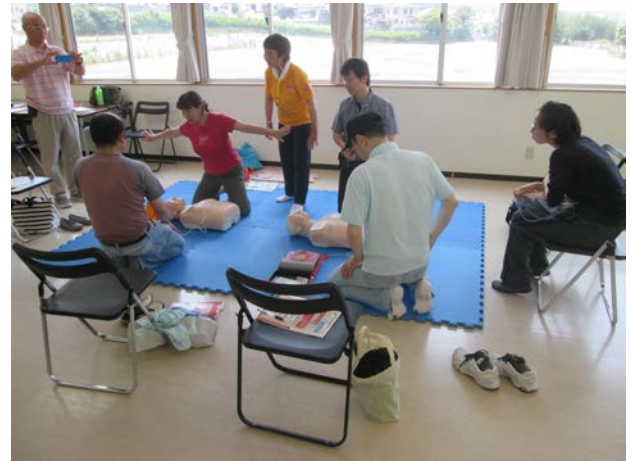
AED を使用する流れを確認します