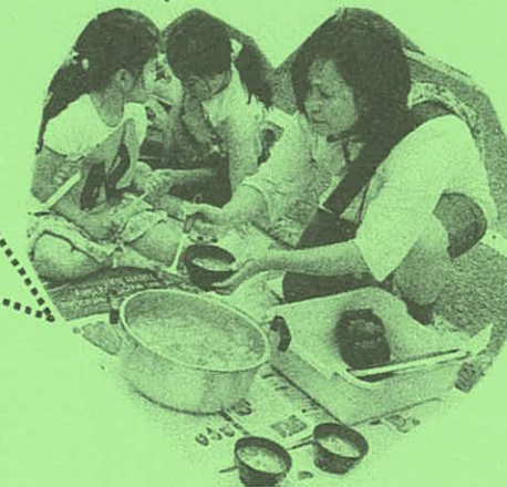
「すいとん、おいしいよ！」

5、6回目のウォークラリーでした。やっぱりつかれたけど、楽しかったです。来年もやりたいです！