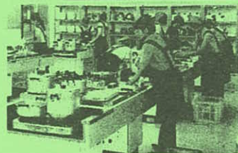
六会中の調理室をお借りしました