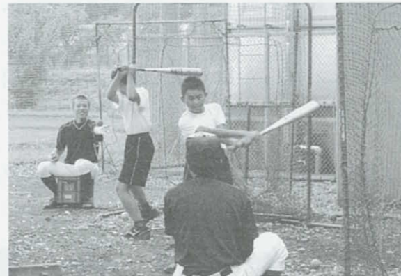
☆ナイスバッティング！

また、楽器体験では、一生懸命に説明を聞いている小学生の真剣な表情が印象的でした。私たちも笑顔で接することができ、小学生のとっても私たちにとても、充実した時間を過ごすことができました。