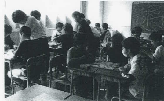
～将棋 さて、次の手は？～

ぼくは将棋で、中学生の人とバトルして、こっぴどく負けました。やっぱり中学生は強いのかな～と思いました。