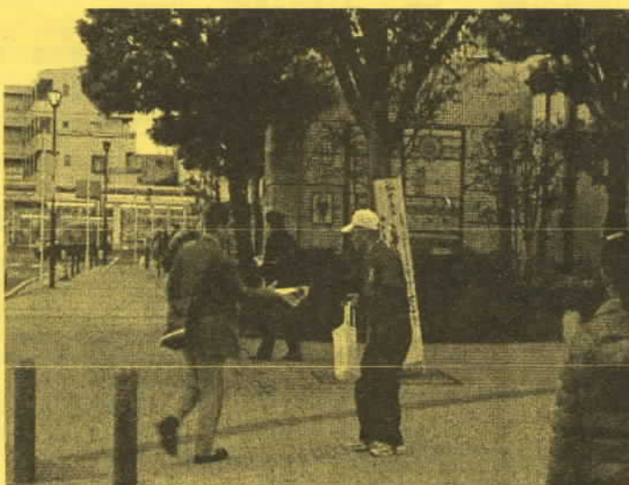
(六会日大前駅で全体集会参加をPR)

地域まちづくり計画の基本計画である地域まちづくり目標及び活動を実現するための『六会地区地域まちづくり実施計画(案)』を提案し、たくさんのご意見をいただきました。誠にありがとうございました。(全体集会の開催状況及び主な意見は終頁に記載いたしましたのでご覧ください。また、議事録は六会市民センターで閲覧が可能です。)