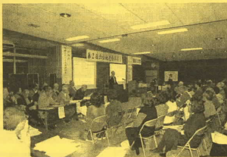
(地域の皆様から貴重なご意見をいただきました。)